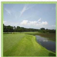
↑画像は決勝コースの紫カントリークラブすみれコースです